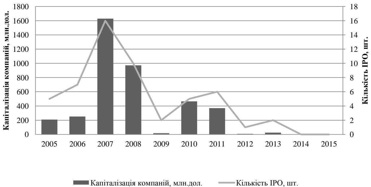
Рис. 2. Зміни обсягів залучених коштів українськими підприємствами за допомогою здійснення IPO за 2005-2013 роки.

Як наведено на рис. 2 за період 2005 - 2013 рр. тенденція зміни обсягів залучених коштів українськими підприємствами за допомогою здійснення IPO носить коливальний характер.