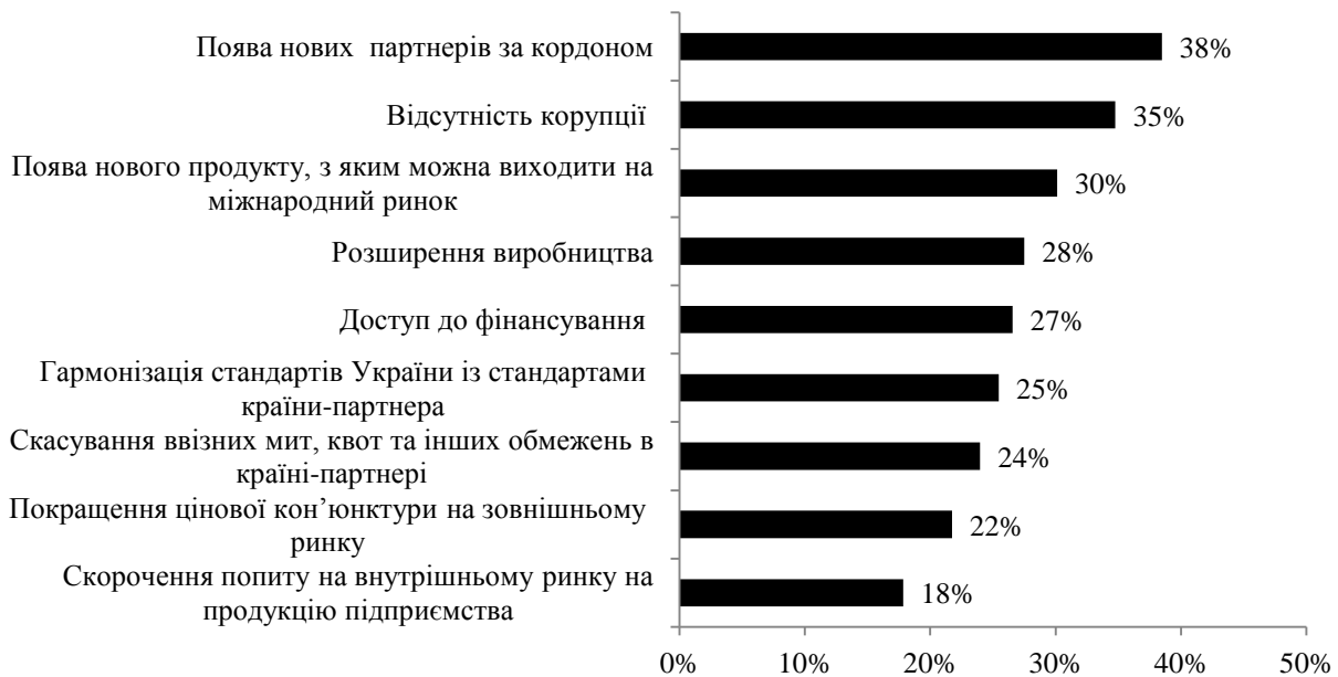
Рис. 2. Умови, за яких підприємства хотіли б розпочати експортну діяльність

здебільшого малих підприємств) – ці проблеми не лише створюють перешкоди до виходу компаній на міжнародні ринки, а й призводять до припинення експортної діяльності компаній-експортерів. За даними дослідження 142 українські підприємства, що раніше експортували свою продукцію припинили експортну діяльність, 60,4% українських підприємств, що раніше не займалися міжнародною діяльністю готові експортувати свою продукцію за наявності певних оптимальних умов, що представлені на рис. 2.