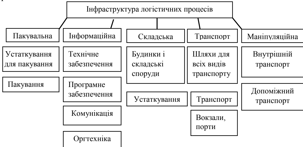
Рисунок 2 – Структурна декомпозиція інфраструктури логістичних процесів

Основні структурні об'єкти логістичної інфраструктури представлені на рис. 2.