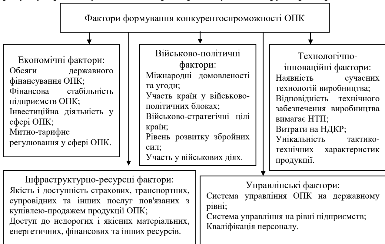
Рисунок 1 – Фактори формування конкурентоспроможності ОПК

Враховавши вищенаведені властивості та базуючись на існуючих загальних класифікаціях факторів формування конкурентоспроможності у сфері ОПК можна виокремити наступні фактори: економічні, військово-політичні, технологічно-інноваційні, інфраструктурно-ресурсні, управлінські (рис. 1). На рисунку 1 розглянуто зміст та характеристику кожної групи факторів.