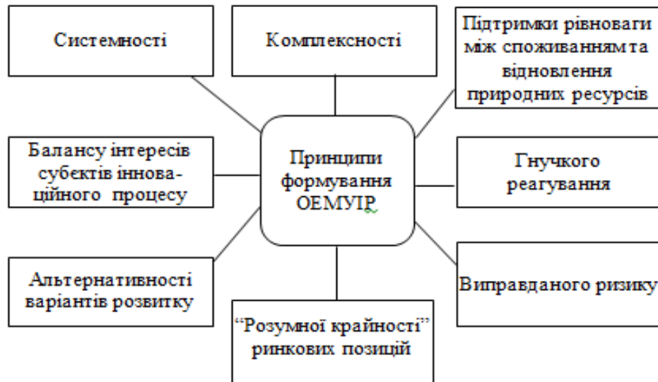
Рис.2.Принципи формування організаційно-економічного механізму розвитку підприємства [8]

Компанія займається виробництвом морозива. Через той факт, що морозиво є сезонним продуктом, що виражається в підйомі, скороченні або повному припиненні виробництва в окремі періоди року - підприємство не може забезпечити себе в зимову пору року. Від цього страждає не лише фінансове забезпечення підприємства, але й персонал, який втрачає роботу у зв'язку зі скороченням, або невчасною виплатою заробітної плати.