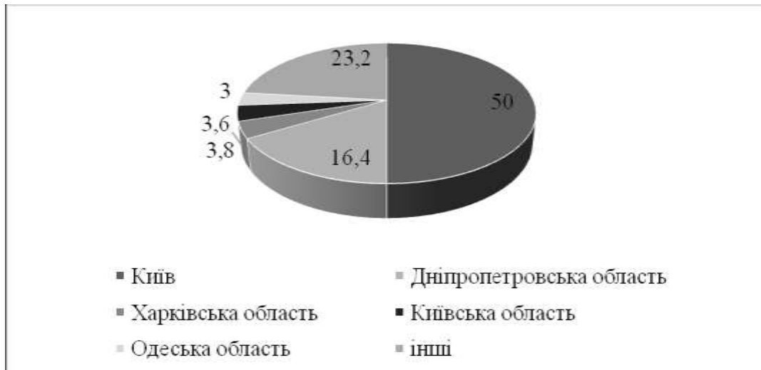
Рис. 1. Регіональний розподіл іноземних інвестицій на 1.10.2014 р. Джерело: [8]

Значна частина регіонів України залишається значно менш інвестиційно привабливими, що й надалі консервує їхню економічну репресивність [8].